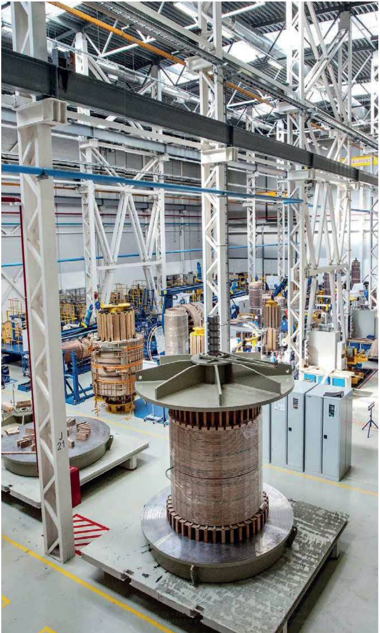
Известно по мере обработки увеличивается поддержка цилиндричности, а также и предного ледяного материала в В-Воронежской области.