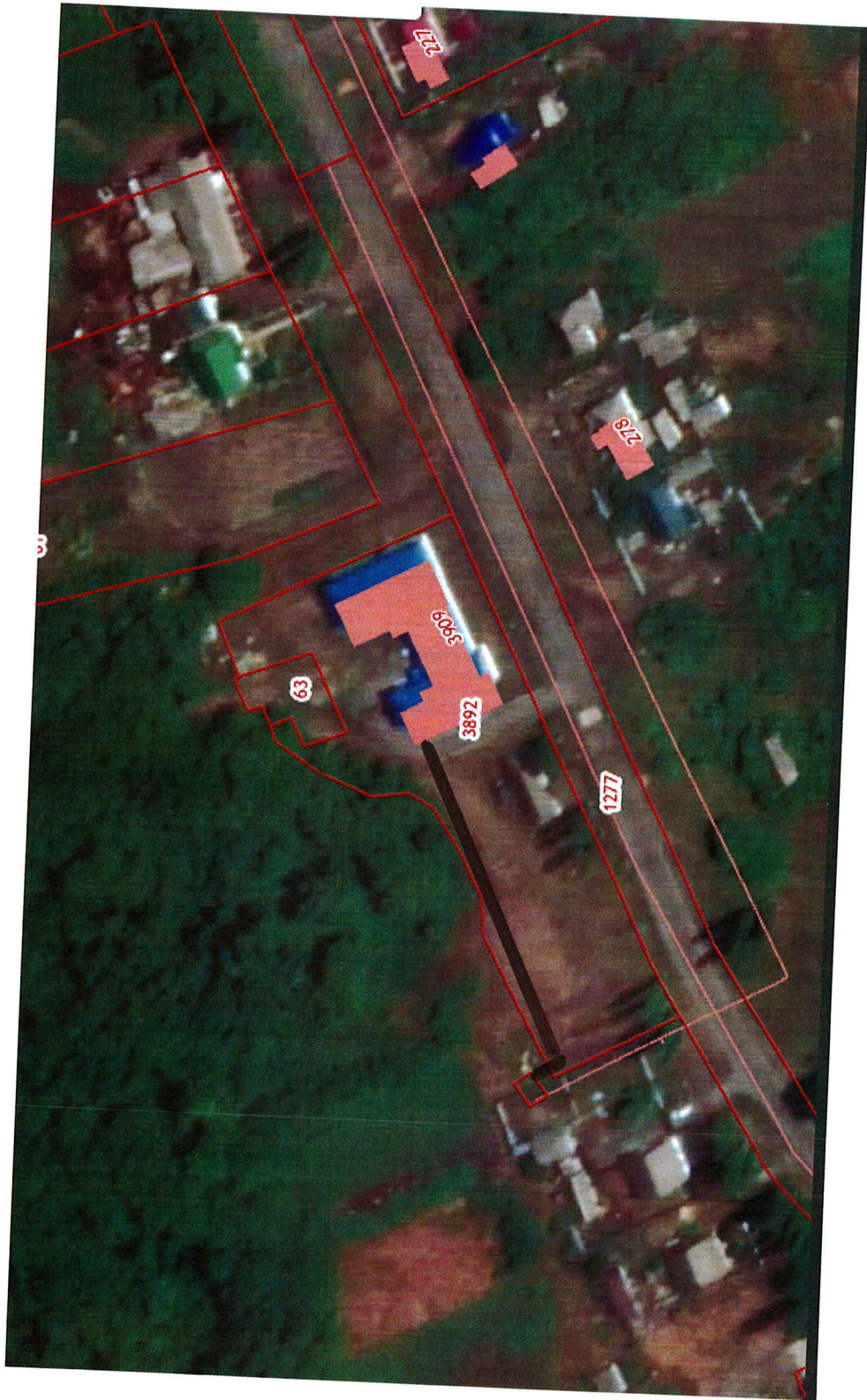
Схема теплоснабжения Сухогаёвского сельского поселения Верхнехавского муниципального района Воронежской области