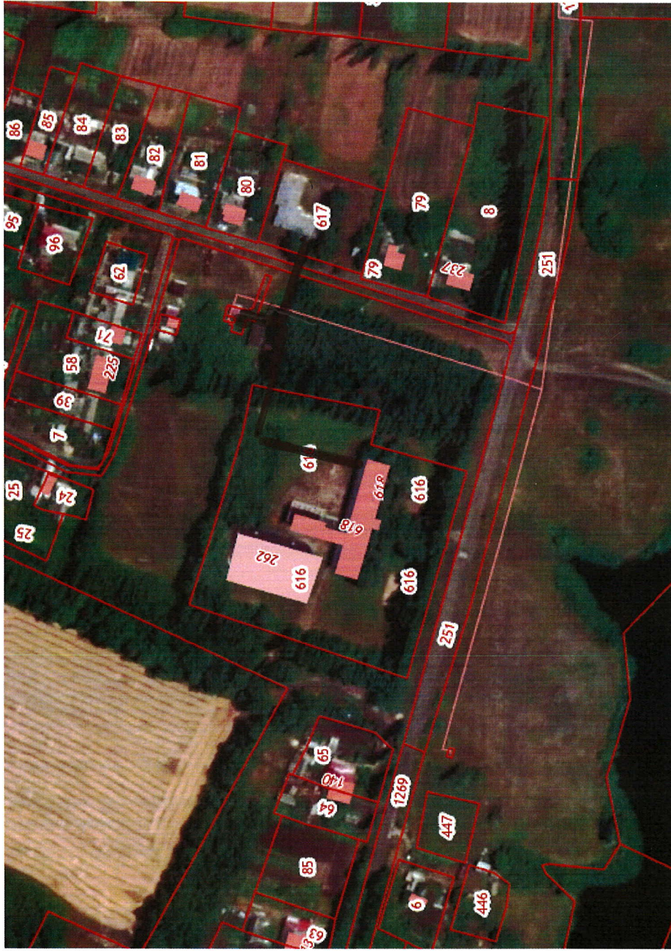
Схема теплоснабжения Спасского сельского поселения Верхнехавского муниципального района Воронежской области