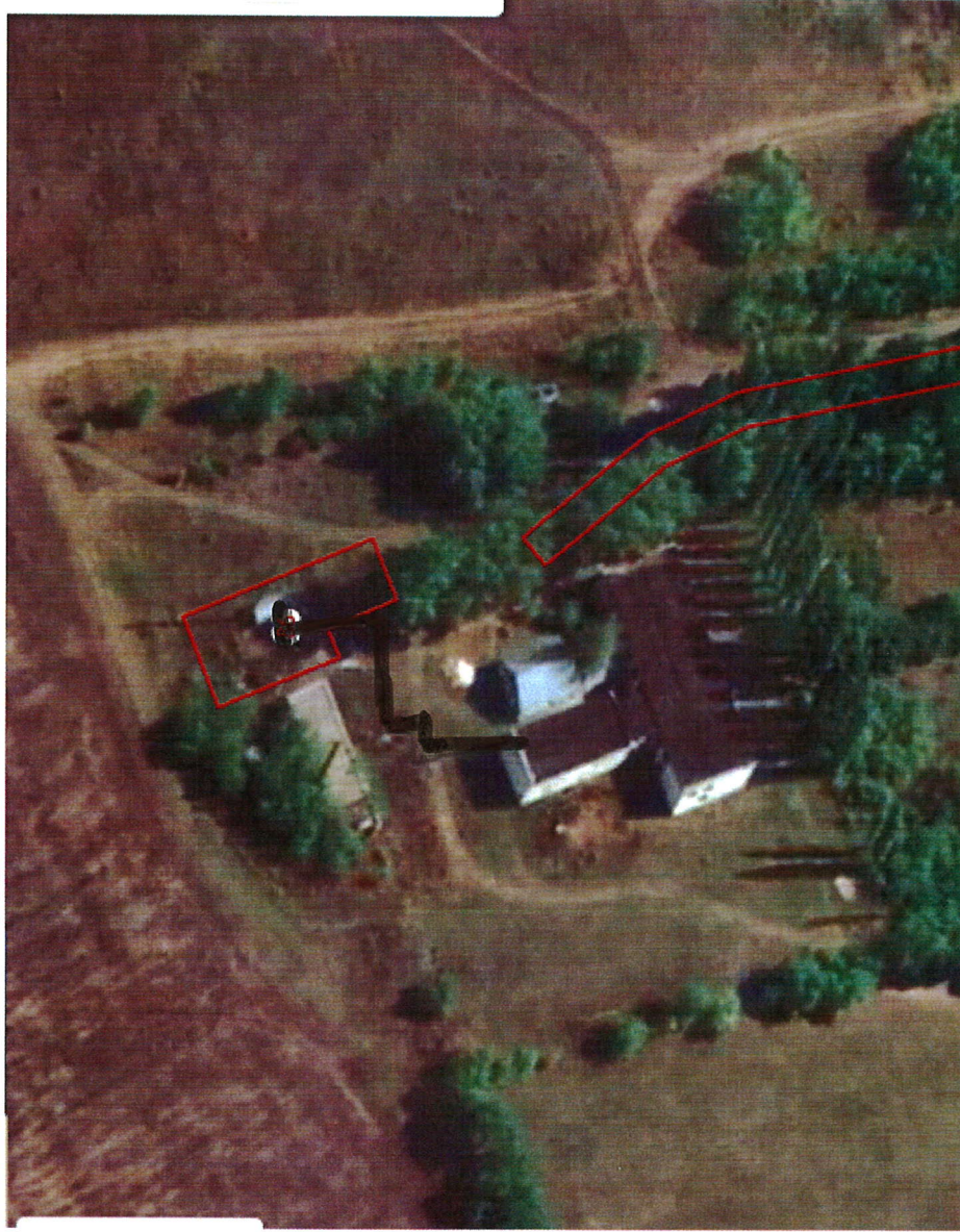
Схема теплоснабжения Семёновского сельского поселения Верхнехавского муниципального района Воронежской области