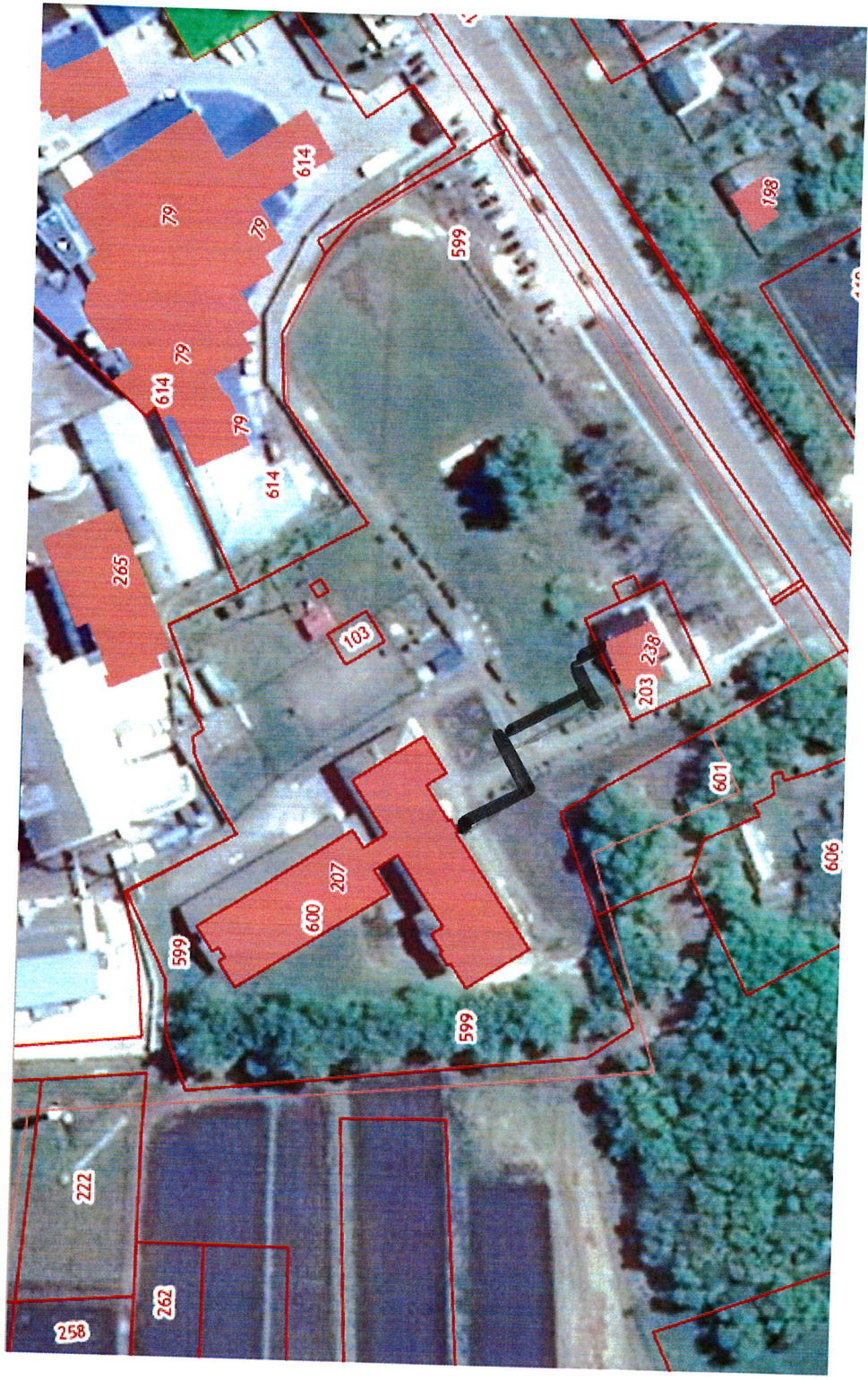
Схема теплоснабжения Правохавского сельского поселения Верхнехавского муниципального района Воронежской области